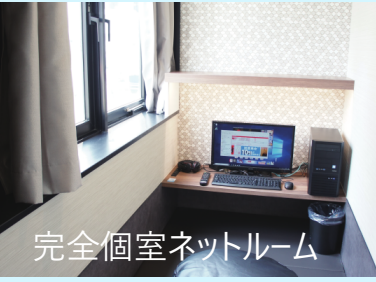
完全個室ネットルーム